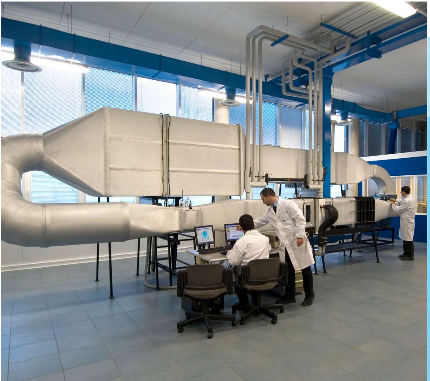
Prova in corso sul tunnel entalpico

E' possibile provare batterie in condensazione ed evaporazione utilizzando una stazione frigorifera mobile, con potenze fino a 30 kW in evaporazione e 35 kW in condensazione. Grazie ad un sofisticato sistema di regolazione è possibile variare la portata di fluido, la pressione di condensazione/evaporazione, le temperature di condensazione/evaporazione, la temperatura di uscita dal compressore, la temperatura di sottoraffreddamento e di surriscaldamento, e quindi impostare tutte le possibili condizioni di prova su condensatori ed evaporatori.